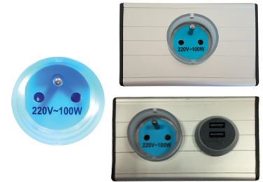
Module prise 1xLxP (mm) : 129.5 x 80 X 40 Socket module 1xWxD (mm) : 129.5 x 80 X 40