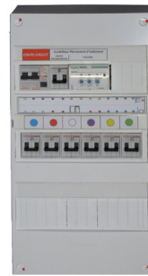
COFFRET DE PROTECTION IT & DELESTAGE PROTECTION & LOAD SHEDDING BOX